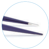
フォーカスタイプ