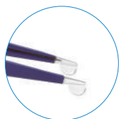
イリゲーションタイプ