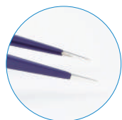
スタンダードタイプ